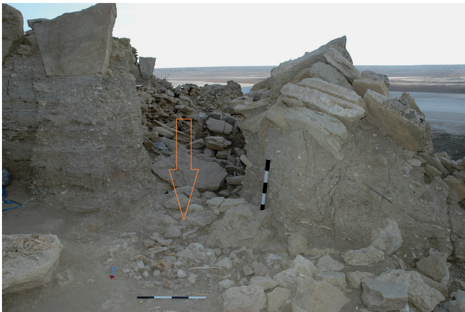
Рис. 2. Токсанбай. Захоронение человека № 1 2-сур. Тоқсанбай. №1 адам жерлеуі Fig. 2. Toksanbay. Human burial no. 1

Источником исследований являются два захоронения, выявленные в разных частях поселения. В первом случае погребение было расположено под внешней стеной помещения, расположенного на западном склоне поселения (рис. 2). Устроители жилища, засыпав постройки нижнего яруса, превратили их стены в своеобразный фундамент, на котором были возведены стены стандартной конструкции: с основанием из двойного ряда вертикальных плит и горизонтальной кладкой из каменных плит сверху, общей высотой более 1,5 м.