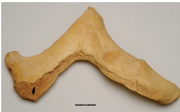
Рис. 4. Токсанбай. Захоронение человека № 1. Изделие из кости 4-сур. Тоқсанбай. № 1 адам жерлеуі. Сүйектен жасалған бұйым Fig. 4. Toksanbay. Human burial no. 1. Bone product