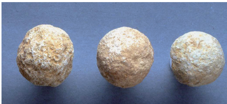
Рис. 3. Токсанбай. Захоронение человека № 1. Каменный инвентарь. Без масштаба 3-сур. Тоқсанбай. №1 адам жерлеуі. Тастан жасалған заттар. Масштабсыз Fig. 3. Toksanbay. Human burial no. 1. Stone tools. Without scale

Экстраординарные погребения с расчленением для эпохи бронзы зафиксированы, прежде всего, в курганных погребениях. Материалы по погребениям на поселениях, особенно на территории Евразии, до середины XX в. были немногочисленны, и поэтому тема до последнего момента оставалась слабо разработанной. На данный момент накоплен значительный материал, иллюстри-