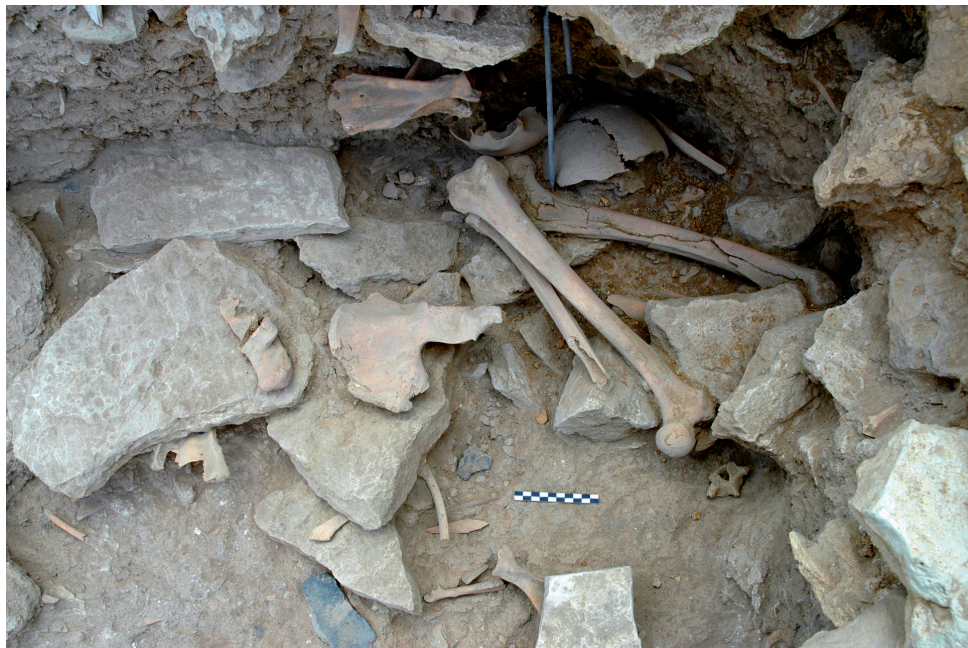
Рис. 5. Токсанбай. Захоронение человека № 2 5-сур. Тоқсанбай. №2 адам жерлеуі Fig. 5. Toksanbay. Human burial no. 2

рующий традицию погребений на поселениях в различных вариациях его проявления на территории евразийского пространства [Алёшкин 1986; Агульников 2010: 185–194; Купцова, Файзуллин 2012; Литвиненко 2011: 7–35; Моргунова, Порохова 1989: 160–172; Моргунова и др. 2001: 99–125; Тамимдарова 2007: 76–77; Файзуллин 2012: 226–230; Худавердян 2018: 5–21; Сеницын, Фисенко 1972: 12–28].